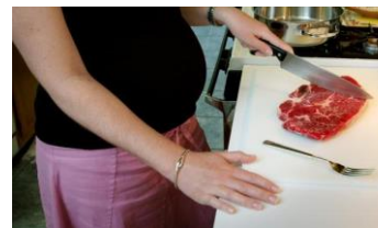
Fautuaga: Faavela lelei fasipovi vili pei o beefburger ina ia 'ena'ena lelei ma ua leai se toto e tafe mai ai.