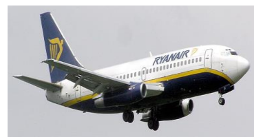
Fautuaga: Toetiiti lava o faama'i typhoid ma paratyphoid uma i Niu Sila e maua a'o malaga solo i atunuu i fafo.