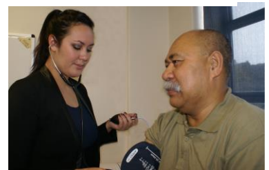
Fautuaga: Vaai se foma'i tau femalaga'iga e te talanoa iai mo tui puipua pe afai e te malaga i atunuu i fafo.

Mo se fesoasoani poo faamatalaga fesoota'i Auckland Regional Public Health Service 09 623 4600