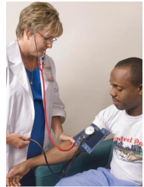
Fautuaga: Afai e te maua i le manava tatā poo le pua'i asiasi loa i lou foma'i o le aiga.

Afai ae e te gasegase i le typhoid, e te maua i āuga o le ma'í, masani lava po'ó le 8 i le 14 aso pe a e pisia i le faama'i. O le paratyphoid e te maua i āuga i le 1 i le 10 aso pe afai ua e pisia ai.