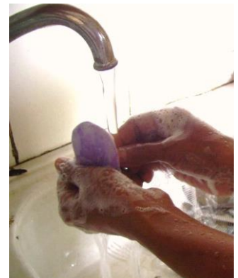
Fautuaga: la fufulu mama lima i le fasimoli i taimi uma ma faamago lelei lima i le masini faamago lima.